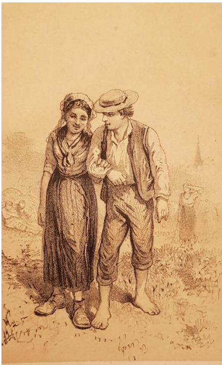
Afbeelding bij een heruitgave van 't Kriekende kriekske.