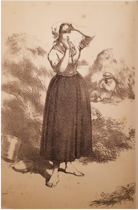
Afbeelding bij een heruitgave van 't Kriekende kriekske.