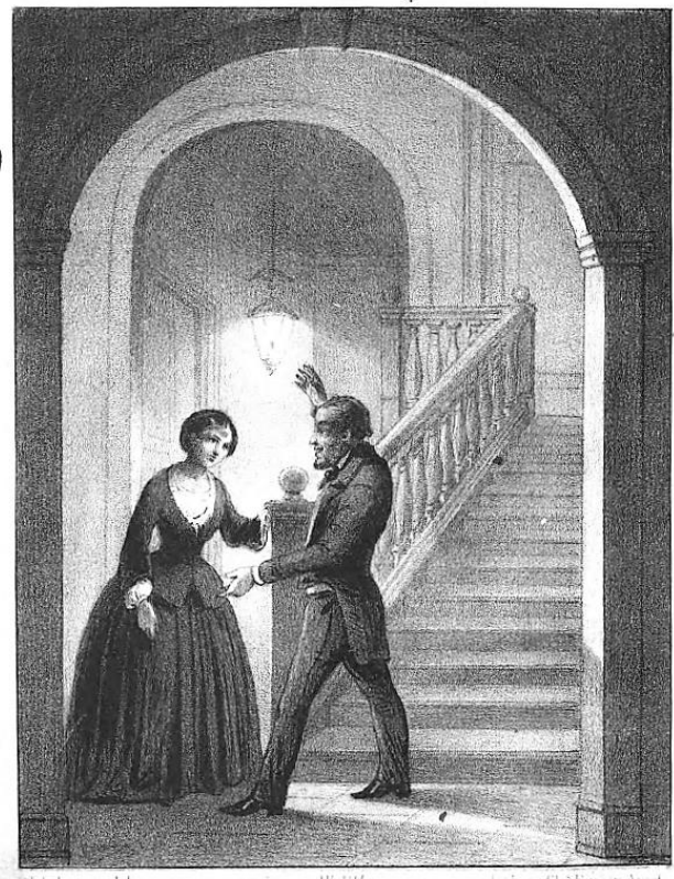
Ik zeg dat ik allenaetig verhefd ben.

Nieuwsblad voor den boekhandel, 21 mei 1857: