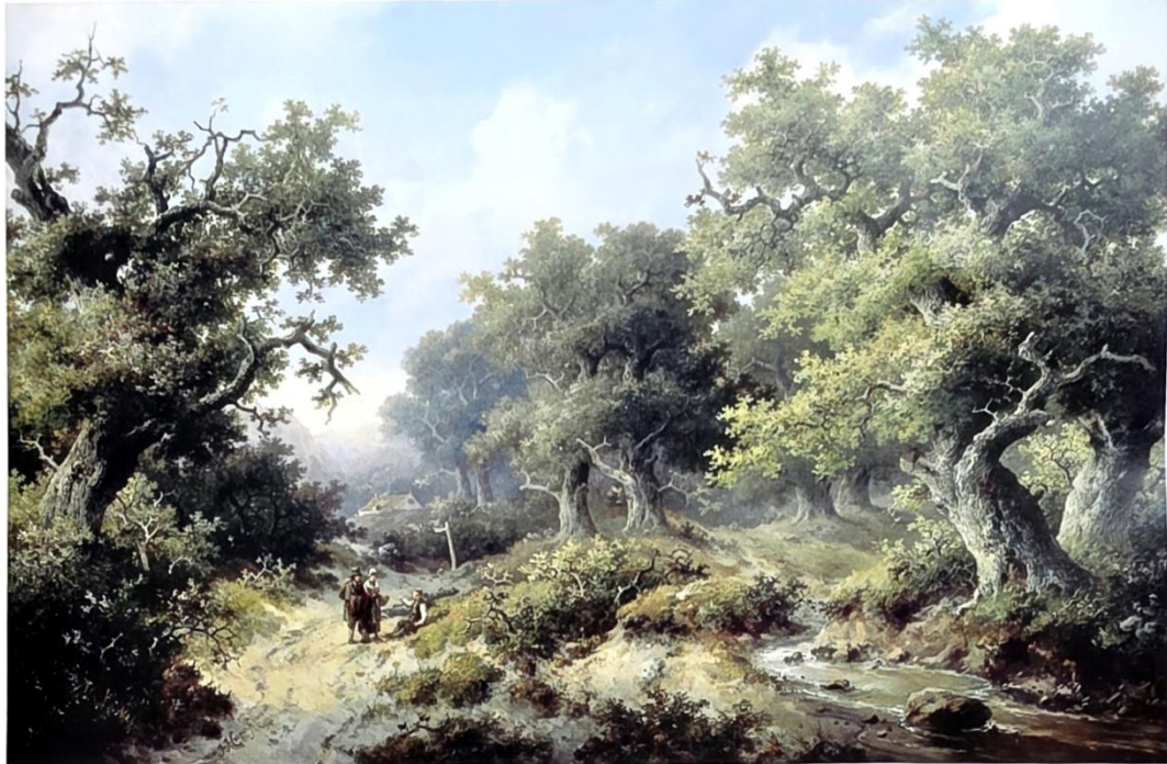
Cremer koos voor de pen, maar was ook een verdienstelijk schilder, zoals te zien op dit Boslandschap met reizigers uit 1849.

naar Cremers nieuwe woonhuis aan de Noord-West-Binnensingel (tegenwoordig Bij de Westermolens). Daar groeide de struik uit tot een prachtige boom. Toen het echtpaar in 1871 verhuisde naar de Van den Boschstraat in het Bezuidenhout ging de vlierbes opnieuw mee. Een jaar later schreef Cremer met zijn verhaal 'Schudden en blazen' een ode aan 'mijn vriend sambucus' (vlierbes). Opvallend genoeg heeft de vlier zijn bewonderaar nauwelijks overleefd, want tijdens een storm op 14 oktober 1881 bezweek de boom. Gelukkig waren er nog stekken en deze konden bij de bank worden geplant.