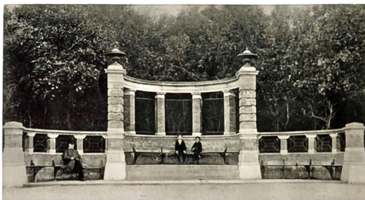
Prentbriefkaart met de Cremerbank rond 1900. Tussen de kolommen zit nog een ijzeren hekwerk, dat inmiddels verdwenen is. Haags Gemeentearchief »

Bij de rustbank zou in elk geval een vlierboom worden geplant, omdat deze de herinnering levend zou houden aan een verhaal van Cremer. In 1856 kreeg de schrijver namelijk van zijn buurman in Loenen aan de Vecht een stek van een vlierbes. Bij zijn verhuizing naar Den Haag ging de vlierbes mee