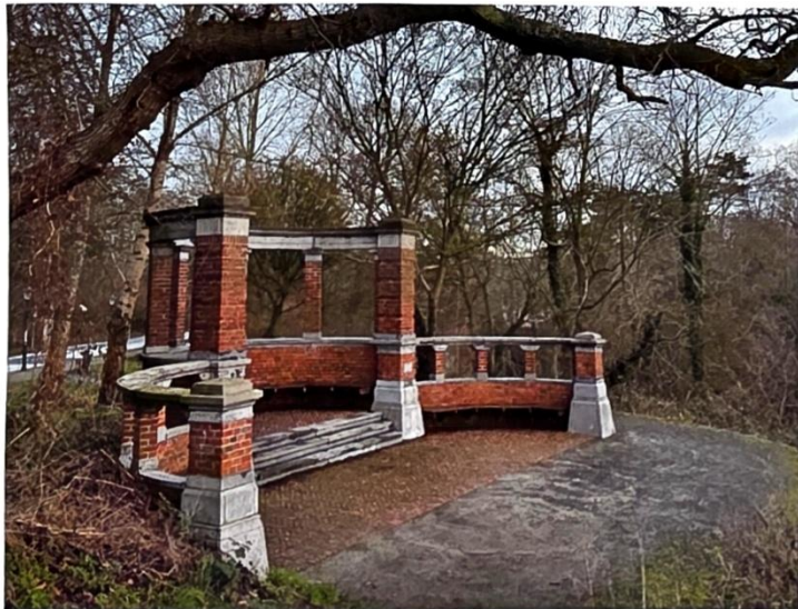
Zo staat de Cremerbank nu aan de Duinweg.