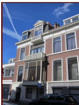
Bazarstraat 2 renovatie Den Haag

Nadat haar man in 1917 om gezondheidsredenen moest stoppen als gemeentesecretaris in Amsterdam verhuisden zij naar Den Haag en gingen in het, inmiddels gesloopte, maar prachtige pand Bazarstraat 2 wonen.