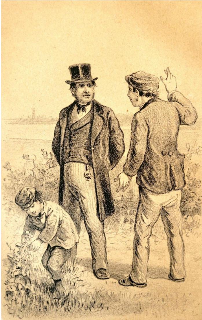
Hoornsche courant, 20 oktober 1872:

klein met de kleinen. Van hier, dat men van hulp- onderwijzers, in 't lezen, schrijven, rekenen wezenlijk voldoende, bij 't examen antwoorden ontvangt, als deze. Op de vraag welke boeken hebt gij zooal gelezen? Ant- woord, na lang bedenken: »'t Pauweverke van Cax- mer". Wat was een stadhouder? Antw. »De stadhouder regeerde 't land, en raadpleegde daarbij de Staten= Generaal". »Plaats de globe in dien stand, waarin d' aarde staat met betrekking tot de zon. d' Examinandus zette de globe rechtstaandig op d' ecliptica." —