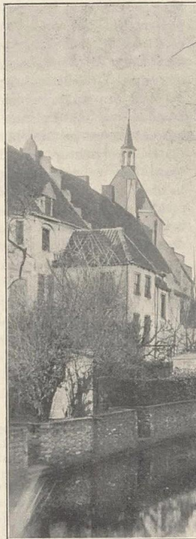
Gezicht in (Naar eene opname van den Amateur te Ut