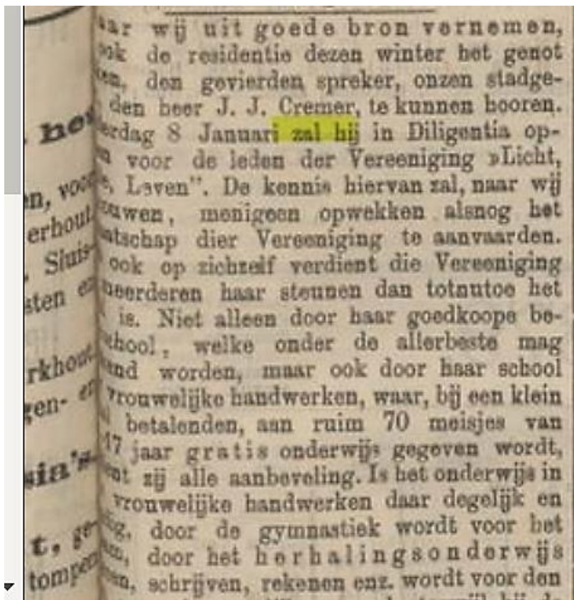
Dagblad van Zuid-Holland en sGravenhage, 18 december 1879: