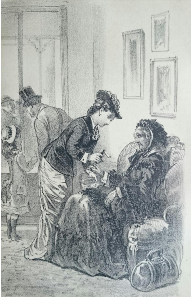
Nieuws van den dag, 14 september 1878:

van GEBROEDERS KOSTER om goede vrienden met het Publiek te blijven!!!!