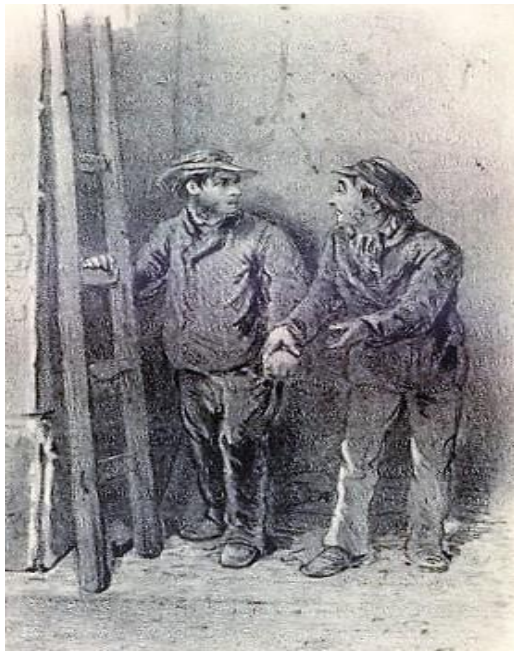
Nieuwe Amsterdamsche Handelsblad, 5 juni 1861: