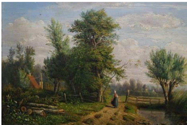
Boerin op een landweg. Schilderij van Lodewijk Mulder.

Ook als schilder was hij actief. Jaarlijks vertrok Lodewijk in de herfst met bevriende schilders naar Gelderland of Drenthe, om daar te schilderen en te tekenen.